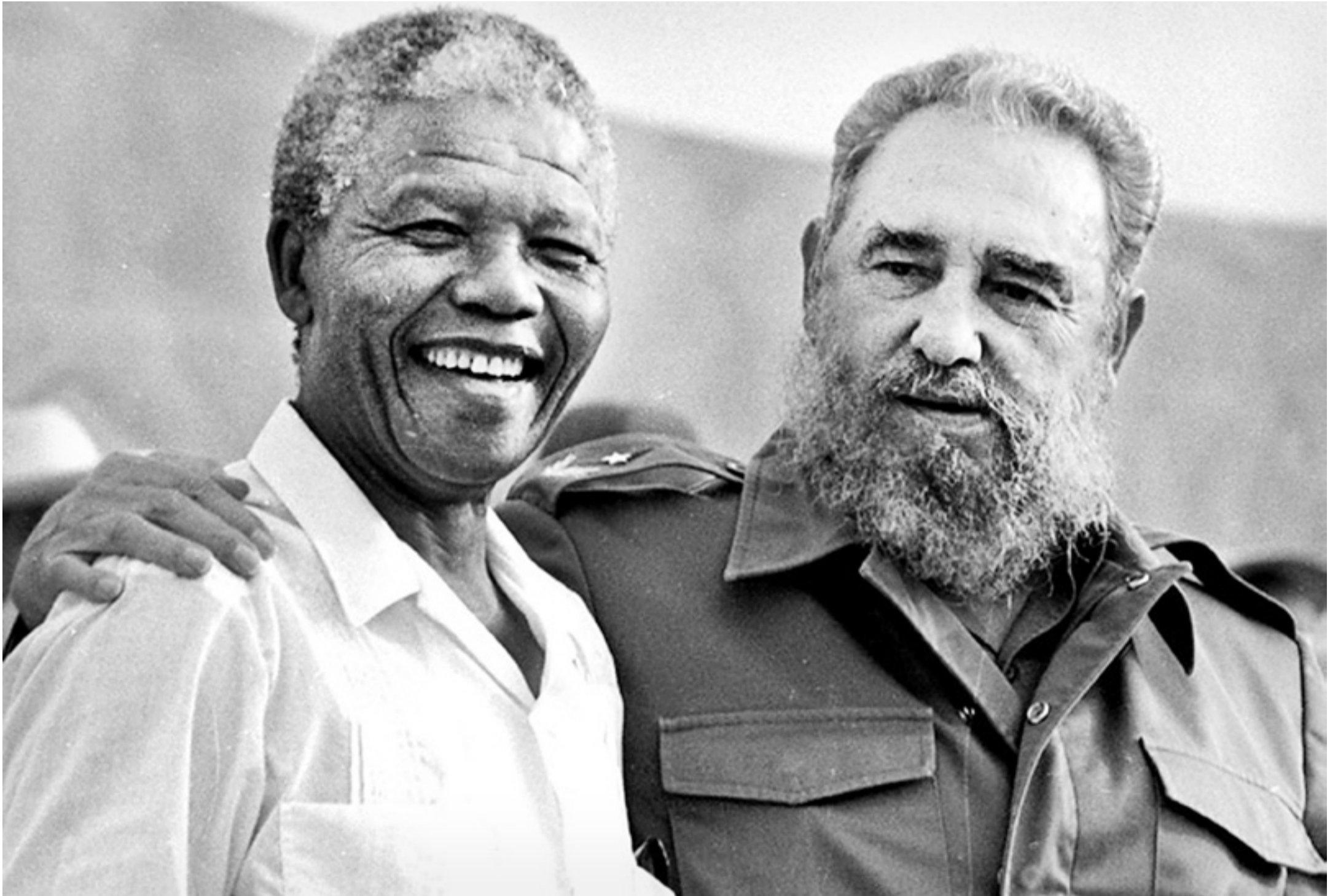
Freunde und Genossen: Nelson Mandela und Fidel Castro bei der Großkundgebung zum Jahrestag des Sturms auf die Moncada-Kaserne 1953 am 26. Juli 1991 in Havanna

■ Seite 2: Zwei Jahrzehnte Widerstand. 1998 begann die Revolution in Venezuela ■ Seite 3: Kubas Triumph. Havanna half entscheidend bei der Befreiung des südlichen Afrika ■ Seite 4: Der Kampf geht weiter. Vor 60 Jahren wurde der Diktator Batista gestürzt ■ Seite 6: Nichts bezahlen. Gespräch über Universitäten in Kuba ■ Seite 8: O-Ton. Fidel Castro über Nelson Mandela